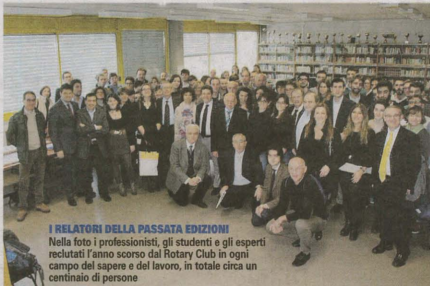
I RELATORI DELLA PASSATA EDIZIONE

Nella foto i professionisti, gli studenti e gli esperti reclutati l'anno scorso dal Rotary Club in ogni campo del sapere e del lavoro, in totale circa un centinaio di persone